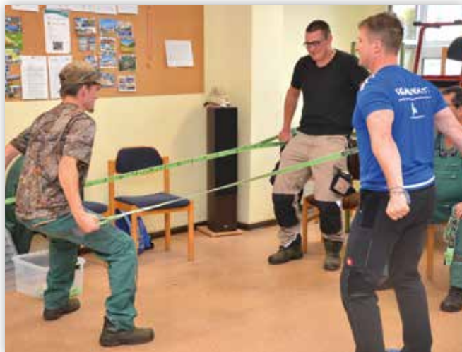
Rückenschule in der Landschaftspflegegruppe

Seit 2017 kooperiert die Evangelische Stiftung Neinstedt erfolgreich mit der AOK Sachsen-Anhalt und bietet ihren Mitarbeitenden über bedarfsorientierte Maßnahmen und Veranstaltungen die Möglichkeit, Gesundheit zu fördern und zu erhalten. Das gilt jetzt auch für die Beschäftigten der WfbM. In verschiedenen Teams und Bereichen ist es bereits gelungen, die Präventions- und Gesundheitsangebote so auf den praktischen Arbeitsablauf abzustimmen, dass ein größtmöglicher gesundheitlicher Erfolg für jeden Einzelnen erzielt werden kann. Die Stiftung profitiert sehr von der ausgezeichneten Expertise und den fachlich hoch qualifizierten Kooperationspartnern. Das BGM ist dahingehend von Bedeutung, dass alle Mitarbeitenden und hier auch Beschäftigten sich in ihrer gegenwärtigen Tätigkeit wohlfühlen und Unterstützung finden. Die gesundheitsfördernden Themenfelder umfassen zum Beispiel, die gesunde Ernährung, Bewegungsangebote, gesundes Schlafverhalten sowie das ergonomische Bewegen und Arbeiten.