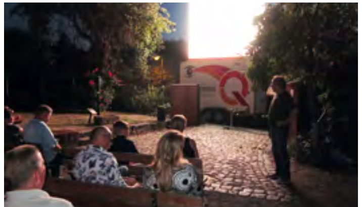
3. Sommerkino am 31. August

In einer Feierstunde haben 27 Absolventen der Krankenpflegeschule am Harzkllinikum Dorothea Christiane Erleben nach dreijähriger Ausbildung ihr Abschlusszeugnis erhalten. Besonders erfreulich ist, dass 20 junge Frauen und Männer jetzt als examinierte Gesundheits- und Krankenpfleger im Pflegebereich des kommunalen Krankenhauses tätig sind.