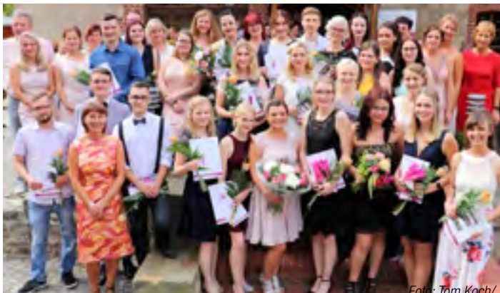
Abschluss der Absolventen der Krankenpflegeschule

Die städtischen Sommerfreizeiten boten auch in diesem Jahr Erholung und tolle Abenteuer für die Acht- bis Zwölfjährigen beim „Flussabenteuer Selketal“ auf dem Gelände des Pfadfinderzentrums Ostharz und auf der „Ziegenalm Sophienhof“. Auf der Alm wurde im Heuhotel übernachtet, von wo aus es zu vielen Unternehmungen ging.