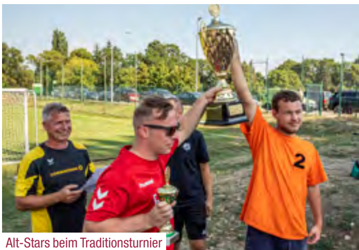
Alt-Stars beim Traditionsturnier

Das 3. Sommerkino im Schulhof der Alten Elementarschule Gernrode war gut besucht. Gespannt waren alle auf den Vorfilm „1000 Jahre Gernrode“ von 1961. So manche Filmsequenz weckte Erinnerungen an vergangene Tage. Im Anschluss kam eine frz. Filmkomödie von 2019 MADE IN CHINA auf die Leinwand. Ein unterhaltsamer Abend, der auch 2020 seine Fortsetzung findet ging zu Ende.