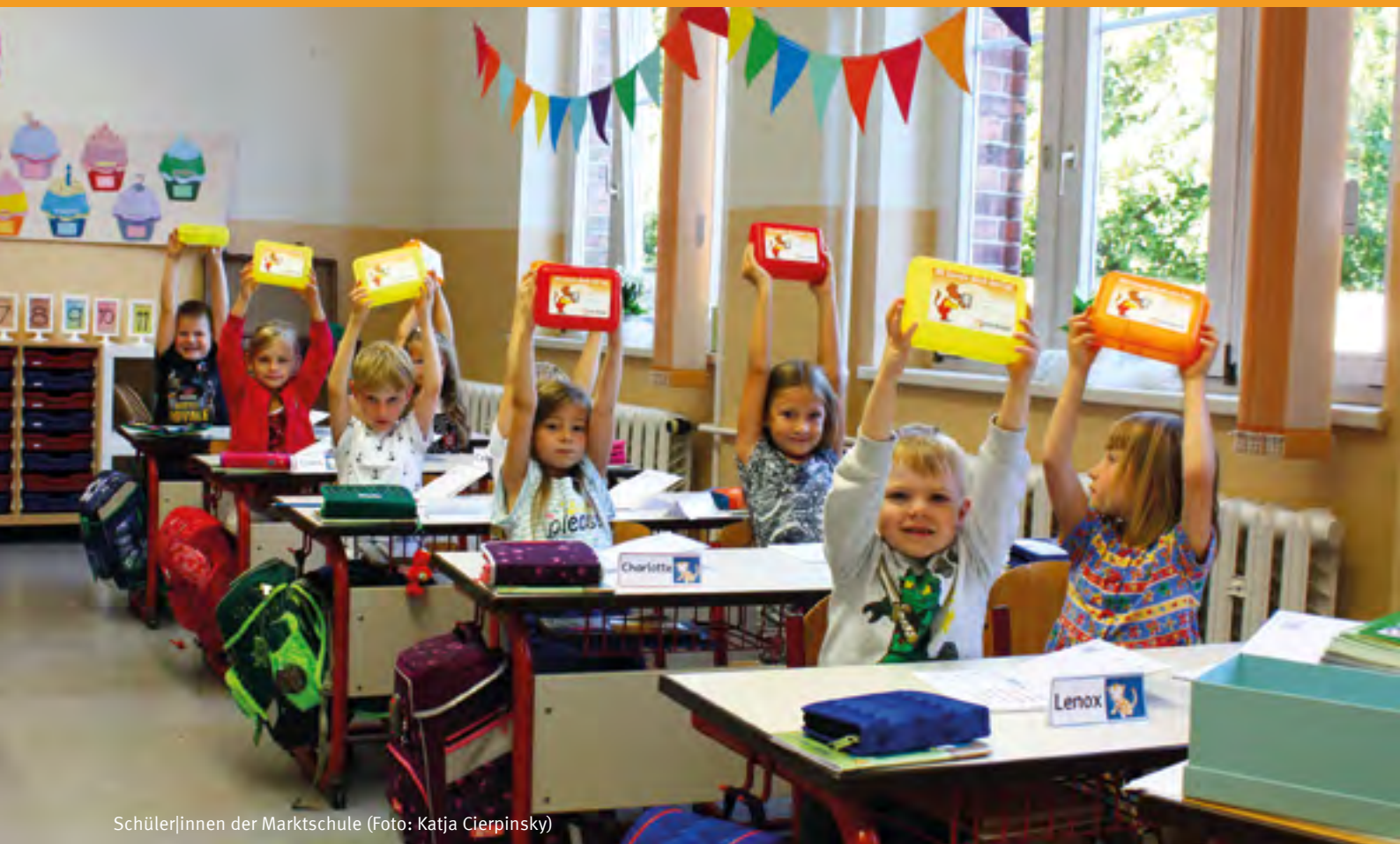
Schüler|innen der Marktschule