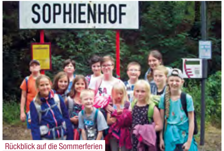
Rückblick auf die Sommerferien

Zum Sommerfest in der Langen Gasse stand wohl die längste Tafel in Quedlinburg. Die Bewohnerinnen und Bewohner feierten gemeinsam mit Angehörigen, Betreuern, Freunden und Mitarbeitenden traditionell mit einer Andacht, mit der Aufführung eines Stückes der Theatergruppe der Langen Gasse, um danach bei guter Musik das Tanzbein zu schwingen.