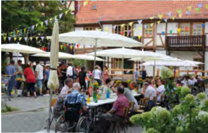
Sommerfest am 29. August