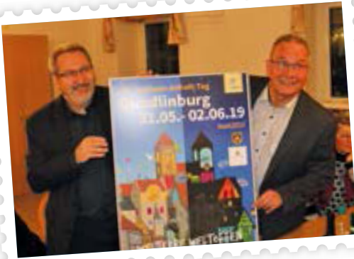
Als herzliche Einladung, Quedlinburg im Festjahr 2019 zu besuchen und auch den Sachsen-Anhalt-Tag gemeinsam zu feiern, überreichte Oberbürgermeister Frank Ruch seinem französischen Amtskollegen Bernard Baudoux das Originalplakat für den Sachsen-Anhalt-Tag.